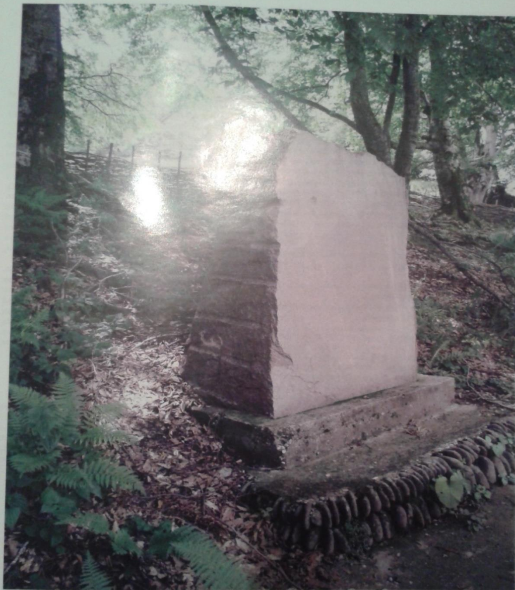
ПЕПНАШ КІЕЛ ТІУЛГ БОГІЙ, ГОНАХА БЕРД ХЬОЙ, БЕЗАМНА БІАРЛАГІА ЕЛАШ ЦИГАХЬ... /ГАДАЕВ М.-С./