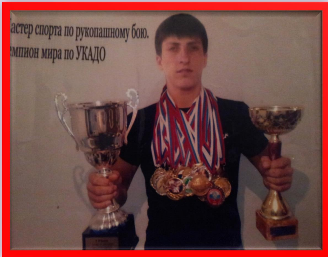
Европан чемпион Мужаитов Мансур